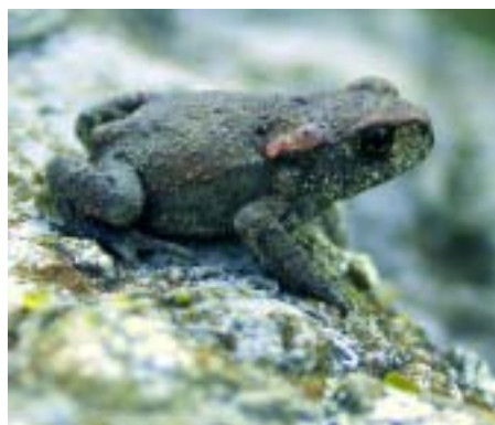
JUVENIL DE SAPO COMÚN. UNO DE LOS ANUROS MÁS AMPLIAMENTE DISTRIBUIDO EN EL HUMEDAL.

las especies introducidas. La población de Galápagos Leproso se encuentra localizada en el río Clarín y no está confirmada la reproducción en la zona; lo más probable es que se trate de individuos soltados o escapados. La Lagartija Italiana se localiza principalmente en las dunas de Ris, aunque también habita prados tras duna y zonas urbanas (como en un parque urbano cercano a la playa). En las dunas la población se conoce al menos desde 1980 (Meijide 1981), siendo muy abundante y reproduciéndose en la zona, aunque no ha colonizado otros sistemas dunares cercanos. Esta colonia