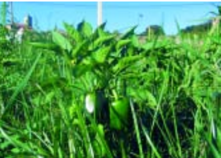
LA JUNCIA ( CYPERUS ESCULENTUS ) COMPITE CON EL CULTIVO DE PIMIENTO, REDUCIENDO NOTABLEMENTE SU PRODUCCIÓN.

La capacidad del ovino para consumir y digerir la Lecherina sin sufrir consecuencias tóxicas y bajo determinados manejos de pastoreo, se ha probado como un método efectivo de reducir la población de Lecherina en pastos ya invadidos (Mora y col. 2005). Esto demuestra la utilidad del pastoreo mixto de diversas especies de ganado como herramienta para equilibrar los ecosistemas pastorales.