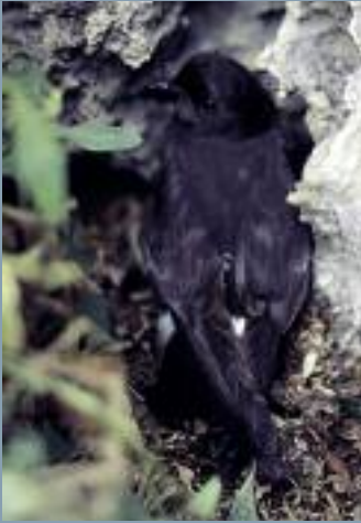
PAÍÑO EUROPEO ( HIDROBATES PELAGICUS )