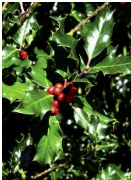
HOJAS Y FRUTOS DE ACEBO ILEX AQUIFOLIUM , UNA ESPECIE BIEN REPRESENTADA EN LOS BOSQUES DEL PARQUE NATURAL.

La ruta transcurre en todo momento por un valle de marcado origen fluvial, típico de la montaña cantábrica, con un río, el Argoza, de carácter torrencial y que en poco más de