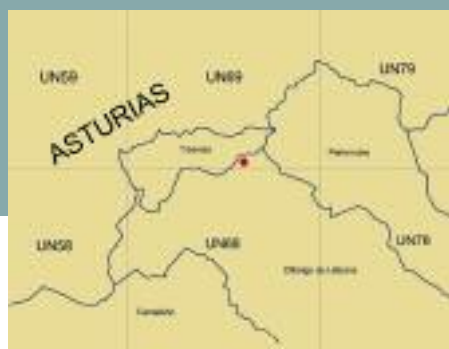
FIGURA I MAPA DE LOCALIZACIÓN DE LA PRIMERA CITA EN CANTABRIA DE SALAMANDRA RABILARGA.

La especie había sido citada con anterioridad en algunas cuadrículas UTM cercanas al límite regional (UN59, UP60, UP70), lo que hacía sospechar de su presencia, ya que los hábitats disponibles son similares. Varias prospecciones sistemáticas se realizaron en el occidente de Cantabria sin éxito (Hartasánchez et al. 1981). La mayor afinidad de la especie por terrenos ácidos